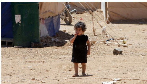
Une enfant syrienne dans un camp de réfugiés de la vallée de la Békaa au Liban. Photo : AFP/ JOSEPH EID—Radio Canada, 56 septembre